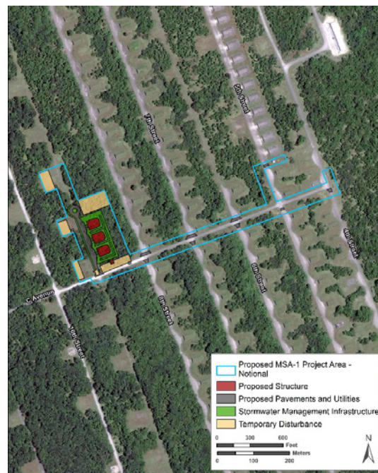
Figure 3: Proposed MSA-1 Infrastructure Upgrades