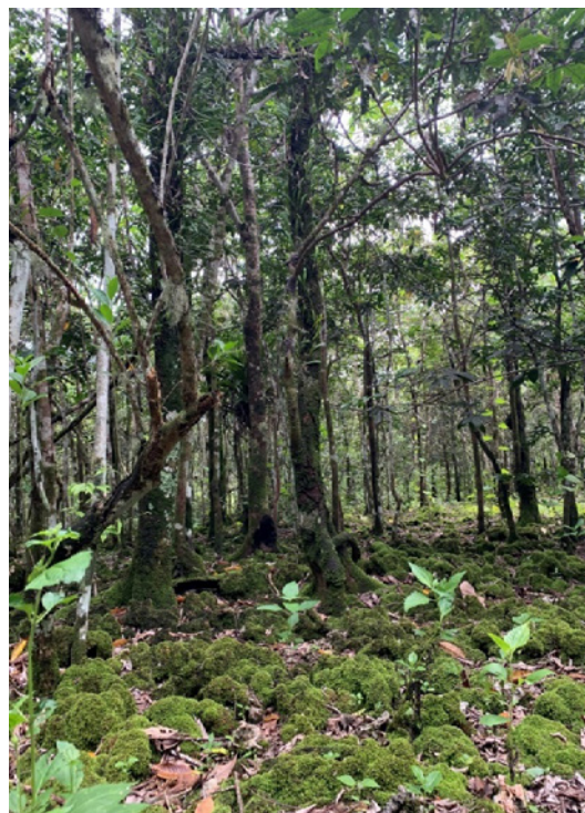
Figuran 4: Hâlom Tâno' kon Âfok yan Trongkon Natibu gi Halom i Notte Ramp na Lugât

Estague' i asunto siha ni guinahan i uriyan tâno' yan tâsi na ma ribisa gi Draft EIS: